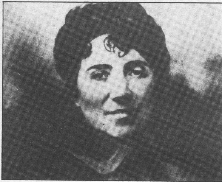
Rosalía de Castro.

Serán as mulleres as que soporten todas as cargas familiares e todos os traballos do campo cando os homes emigran por centos de miles desde finais do século XIX, primeiro a América e despois a Europa, quedando como "viuvas de vi-