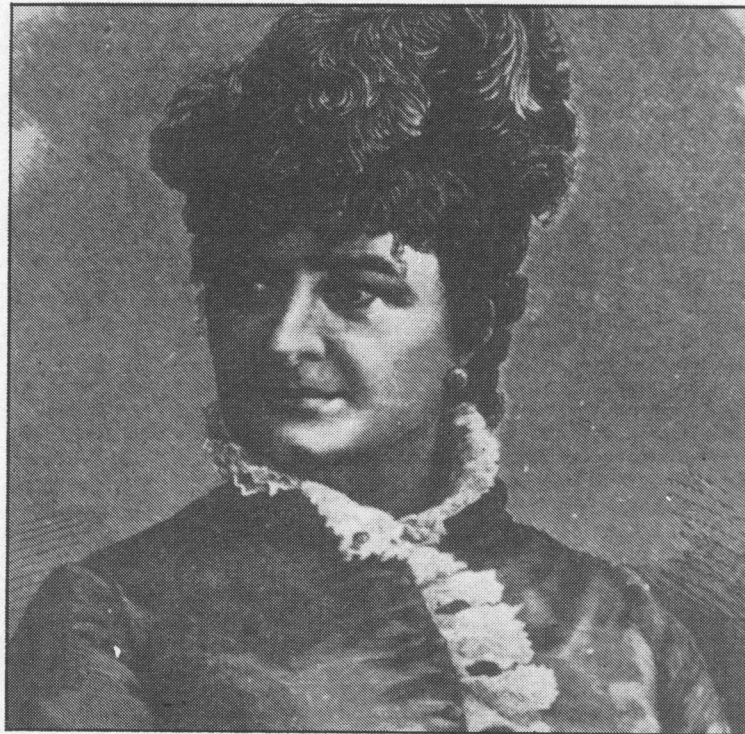
Emilia Pardo Bazán.