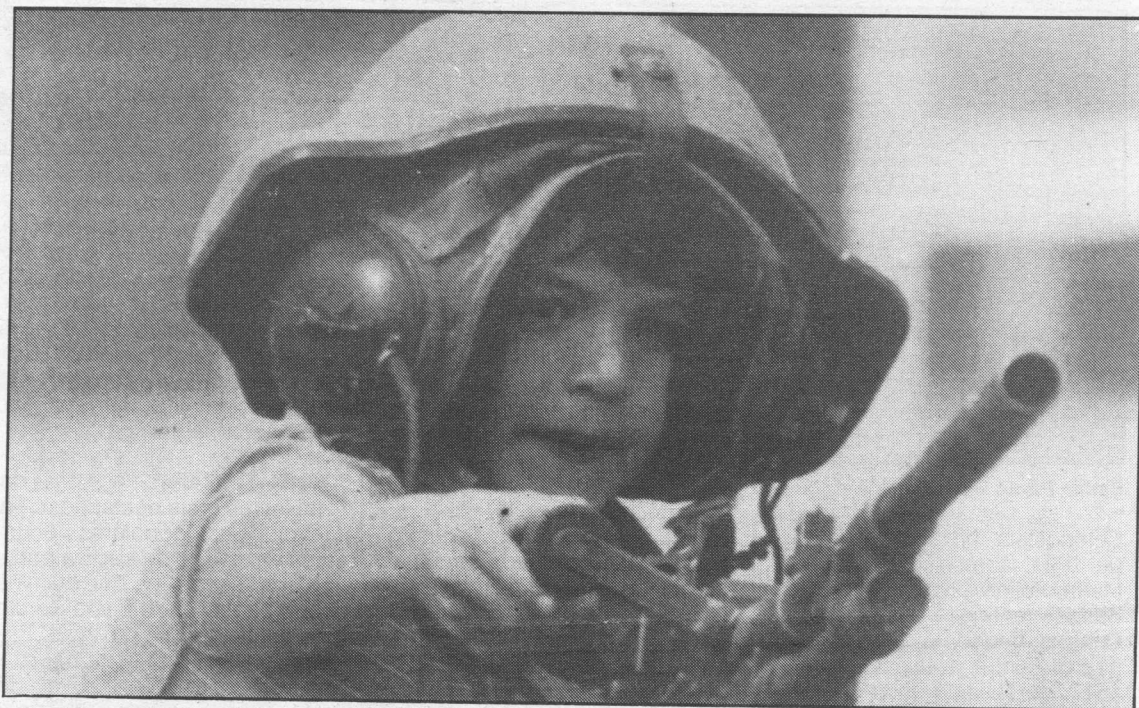
Os nenos hai que explicarlle a guerra obxetivamente.

para salvar ideais democráticos, senon pola hexemonía do poder, hoxe polo petróleo e mañá por calquer outra razón que a poña en perigo. Os países poderosos, ademais do monopolio da riqueza, de seren árbitros da guerra e da paz, adxudícanse o da cultura e o da democracia. A nosa paz non é só a retirada de Kuwait, é a posibilidade de desenvolverse como persona nunha sociedade máis xusta e igualitaria entre homes e mulleres, entre países ricos e probes, entre o Norte e o Sul. “O desarme universal comenza polo desarme cotián. Esa vida diaria das mulleres que non libran a súa loita contra os cañóns, pero si enfrontado os malos tratos as agresións e as discriminacións, produto da desigualdade e da prepotencia desta sociedade”. (Cristina Almeida, 1991).