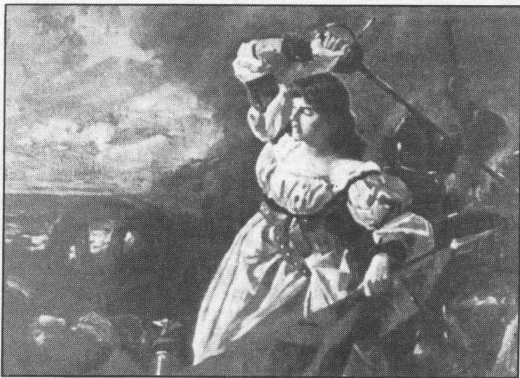
Recreación de María Pita.

E bastante coñecido, e o mesmo se ten deformado como tópico, que o papel das galegas na sociedade rural tradicional tivo unha maior importancia que en outras culturas; e a sociedade tradicional aínda está presente entre nós. A muller en Galicia non só se ocupa do traballo doméstico como noutras culturas, senón que sobre ela recae gran parte do traballo agrario (coidar do gando, traballar a terra,...), de forma exclusiva cando emigran os varóns da familia e compartida en non menos do cincuenta por cento cando os varóns están presentes, xa que determinadas tarefas como a de comercializar os excedentes agrarios, seguen sendo esencialmente femininas. A importancia das actividades das mulleres na nosa cultura ten orixes moi remotas. Aos escritores romanos, nos que estaba solidamente asentada a ideoloxía patriarcal, resultáballe chocante o protagonismo feminino na sociedade castrexa e describen as bárbaras costumes de cántabros, astures e galaicos entre os que as mulleres tiñan a propiedade de terras e eran elas as que deixaban en herdanza ou dispuñan o casamento dos seus irmáns va-