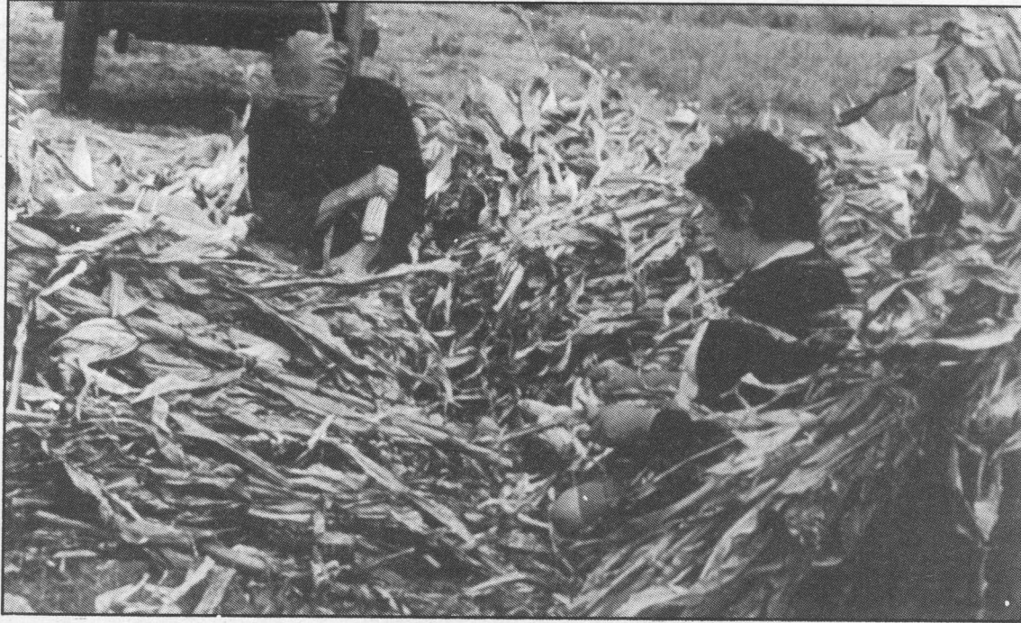
A muller desenvolve case tódolos traballos do agro.

Están a roubarnos a metade da nosa historia: a historia feita por media humanidade, tan decisiva, que sin ela non habería a outra media. Os libros da Historia que se ensina nos colexios non mencionan apenas accións de mulleres. Cando reivindicamos esa presenza non o facemos tan só por unha mínima xustiza ou de solidariedade co 50%, anónimo, do xénero humano; facémolo ademais porque esquencer as vidas de persoas que nos precederon é unha falsificación.